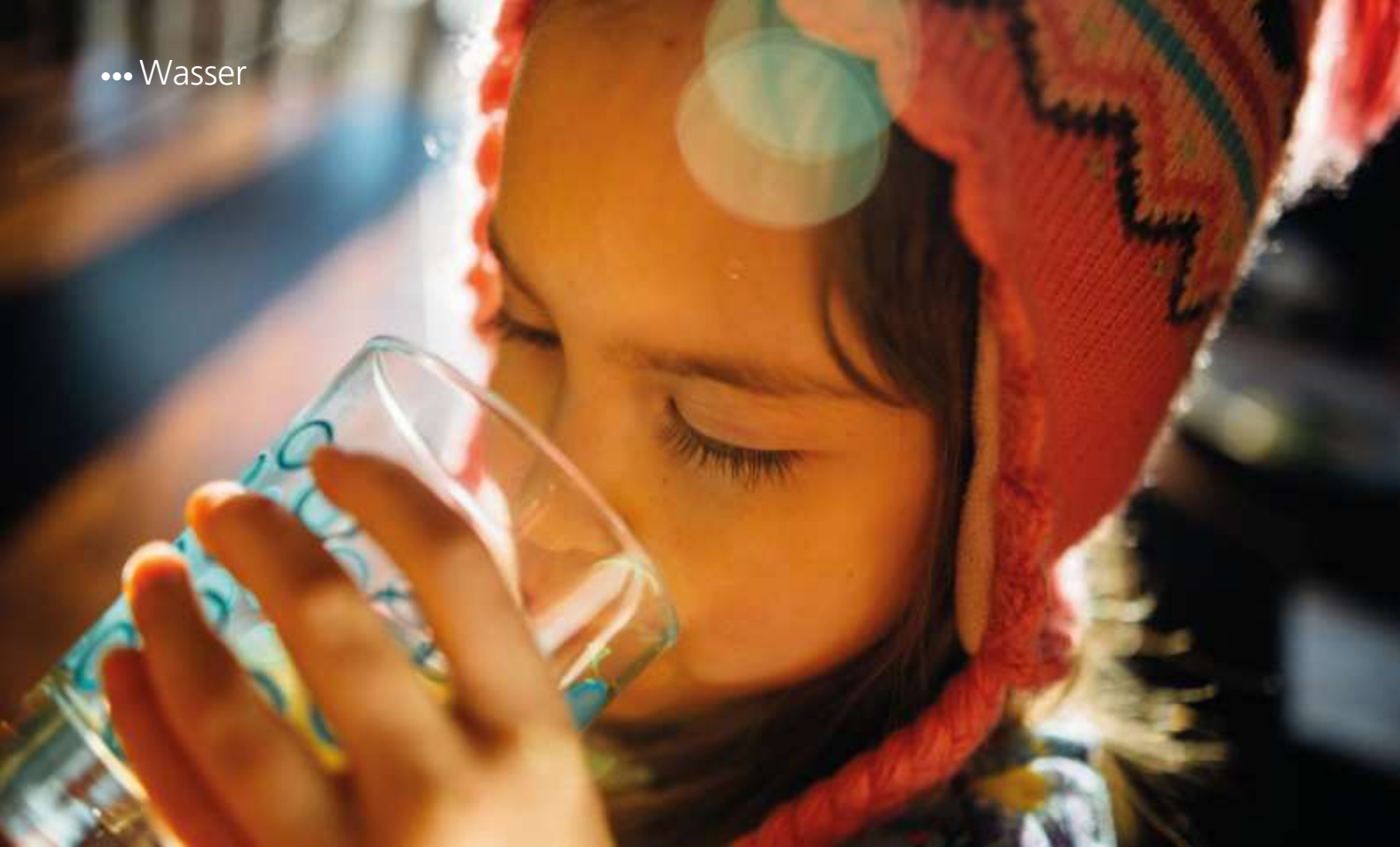
Ein kostbares, aber oft unterschätztes Gut: Trinkwasser.