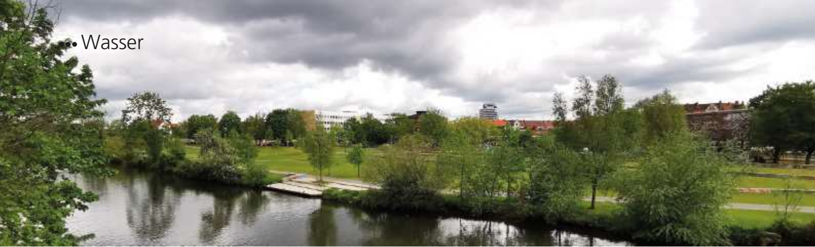
Zu Fuß oder mit dem Fahrrad immer am Fluss entlang.