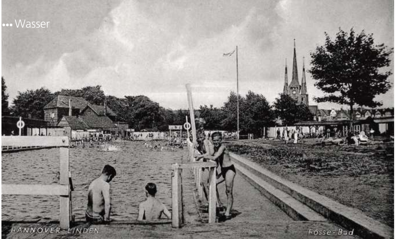
Das Fössebad diente schon vor dem Zweiten Weltkrieg dem sportlichen Vergnügen.