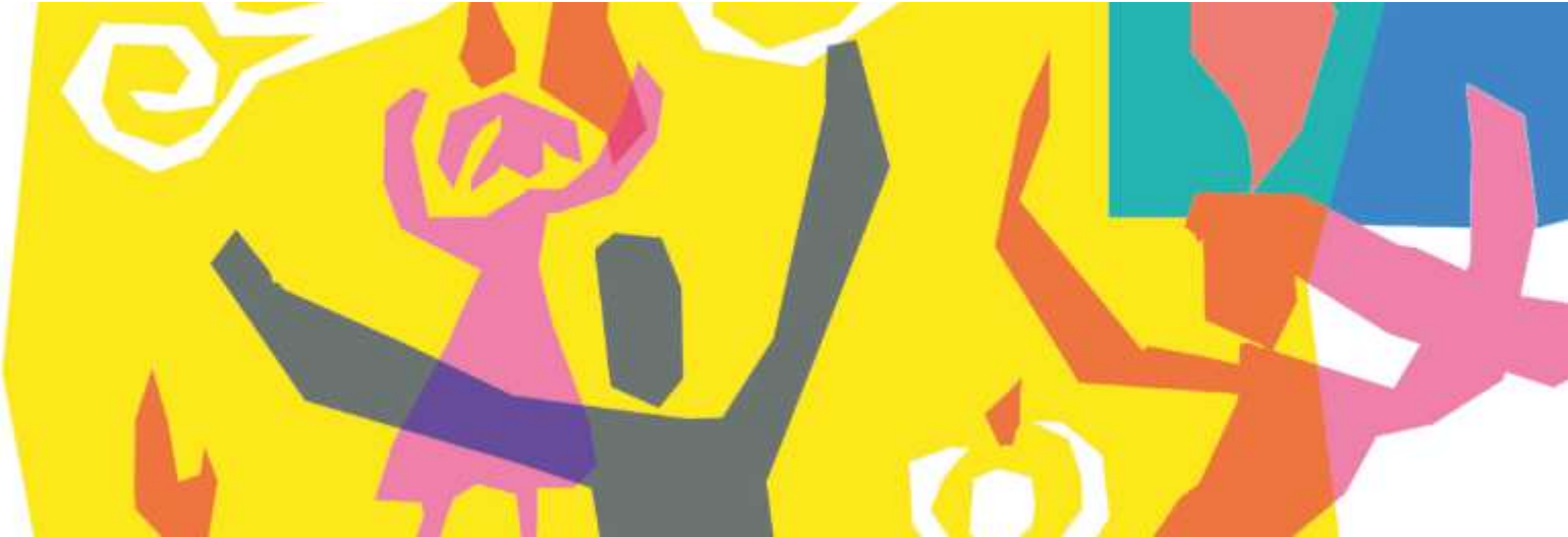
Live-Musik auf der Bühne, Kinder-Olympiade, Kuchenbuffet im Pfarrgarten - das Sommerfest an der Bethlehemkirche