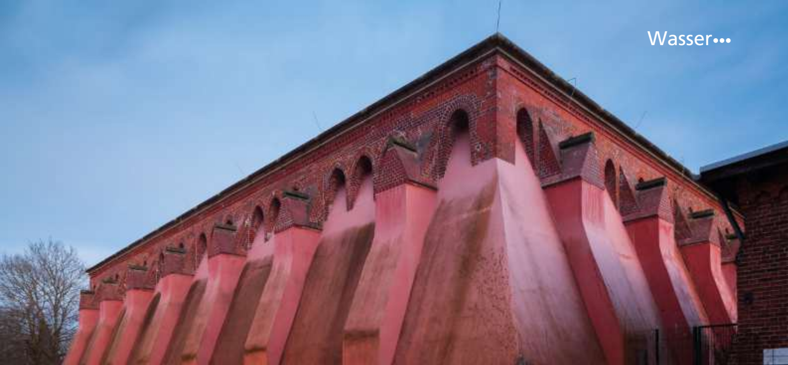
Seit fast 150 Jahren sorgt der Wasserhochbehälter für genügend Wasser in allen Hähnen.