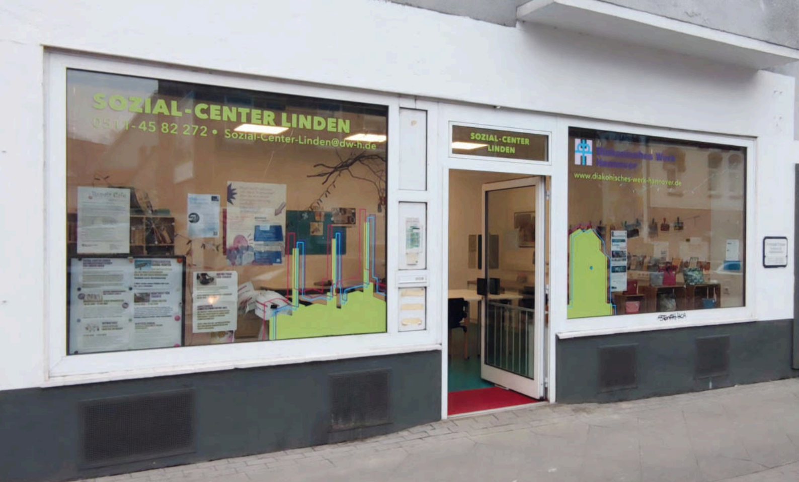
Sozial-Center Linden im Kötnerholzweg 3.