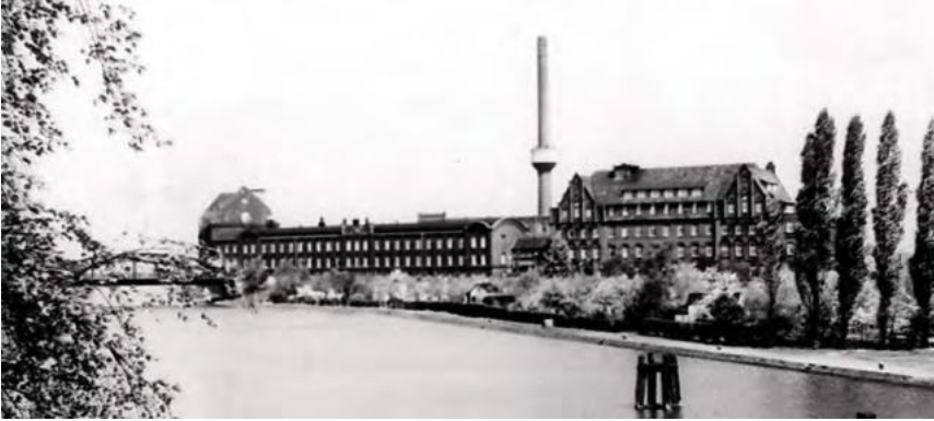
Das Continental-Werk in Limmer um 1956, Foto: Privatbesitz Hartig

Mehr als 1000 Frauen, vor allem aus Polen, Frankreich und der Sowjetunion, waren zwischen Juni 1944 und April 1945 im Konzentrationslager Conti-Limmer gefangen. Sie leisteten schwerste Zwangsarbeit für die Continental und die Brinker Eisenwerke, litten unter Hunger, Schlafmangel, fehlender Hygiene und entwürdigenden Bestrafungen. Kurz vor der Befreiung Hannovers wurden sie gezwungen, zum KZ Bergen-Belsen zu marschieren, wo viele von ihnen starben. Nur 78 Kranke blieben in Limmer