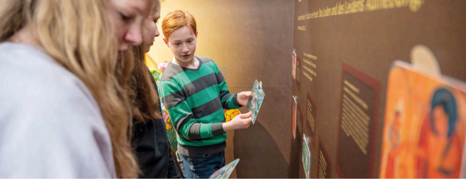
Ausstellung Haus der Religionen.