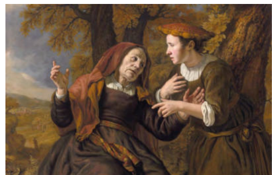
Rut schwört, Noomi nicht zu verlassen. Jan Victors, 1653. Public domain.